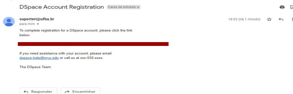
Figura 05 – Mensagem de acesso a URL recebida por e-mail.

Acesse o e-mail e clique na URL recebida (figura 05).