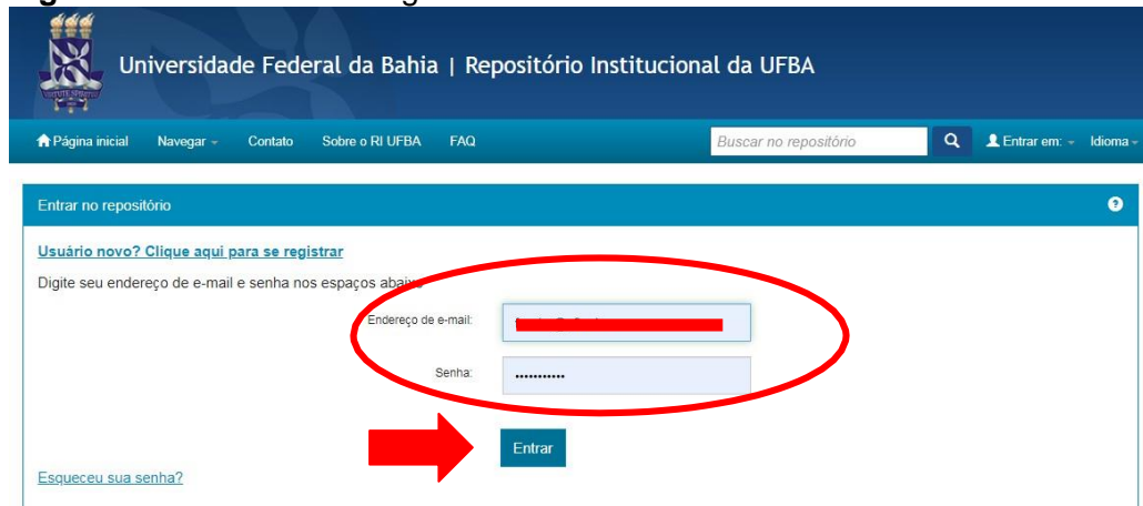
Figura 09 – Acesso com login e senha.

Preencha os campos com o e-mail registrado e senha cadastrada e clique em “ Entrar ”, conforme a figura 09.