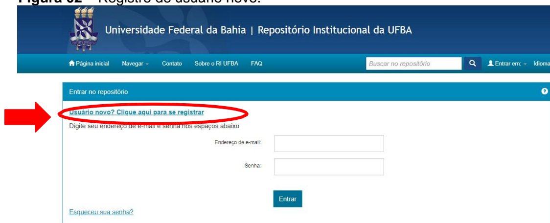
Figura 02 – Registro de usuário novo.

Clique em “ Usuário novo? Clique aqui para se registrar ”, conforme figura 02.